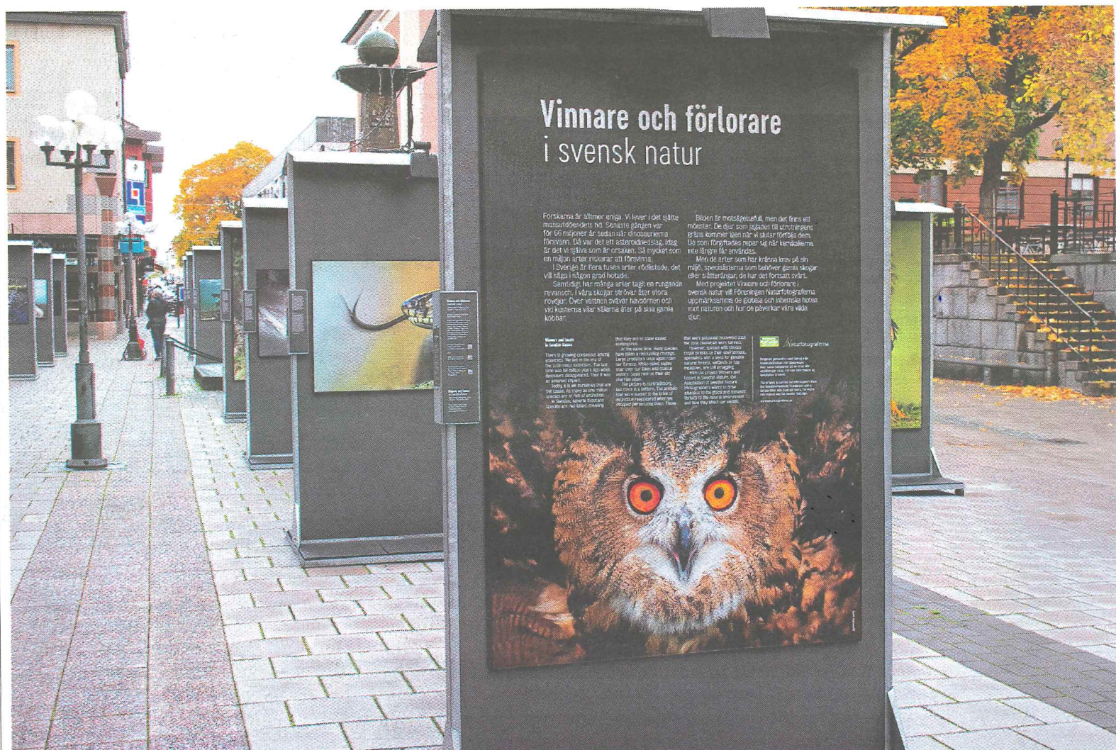
Djurvärldens vinnare och förlorare porträtteras i en ny utställning i Falu centrum.

Följ kulturen på både Facebook och Twitter: Facebook: facebook.com/dtnojkultur Twitter: @dtkultur