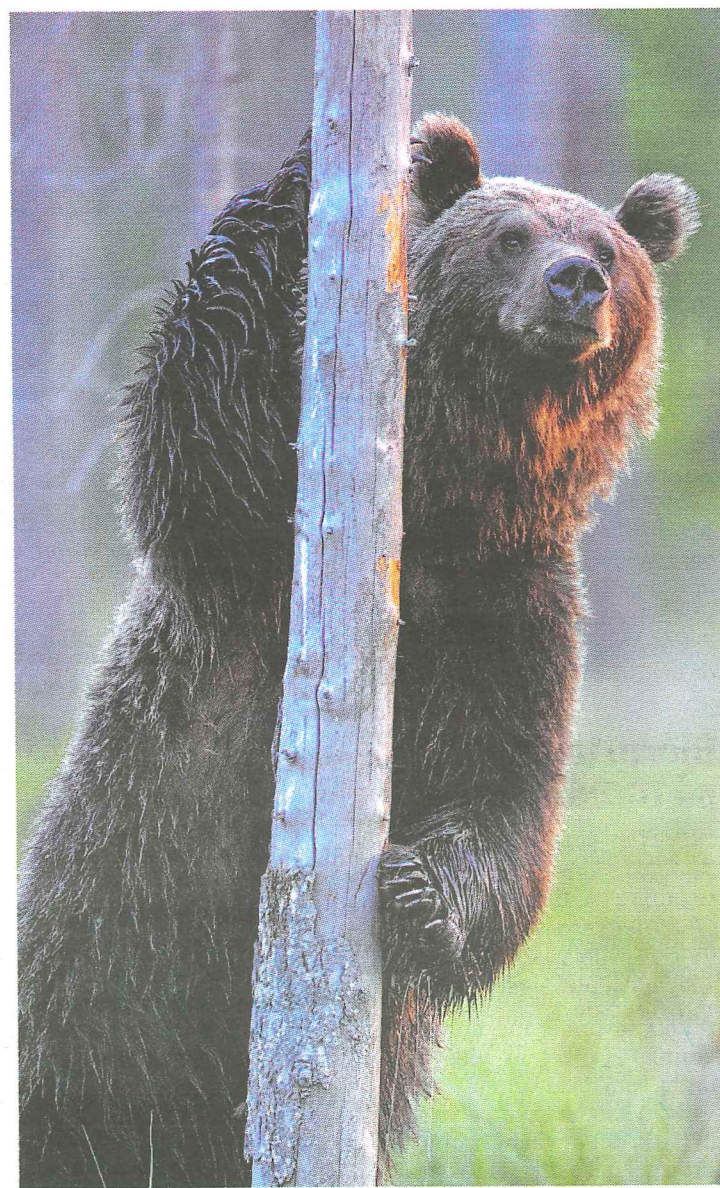
Brunjörnen var nästan utrotad, men stammen har återhämtat sig kraftigt.

"Vinnare och förlorare i svensk natur" Rådhusorget, Falun Utställningen arrangeras av Föreningen Naturfotograferna i samarbete med Dalarnas museum och Centrala stadsrum. Visas till och med 8/11.