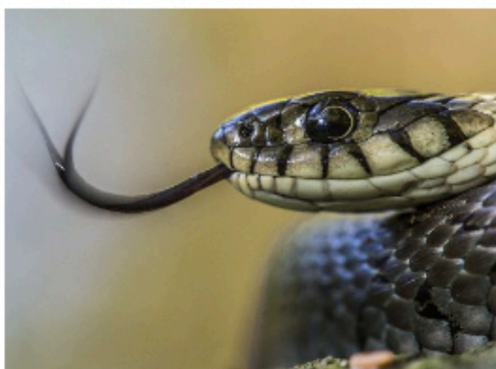
Fotografen Johan Linds bild av en snok är en av de 35 bilderna som kommer att ställas ut.